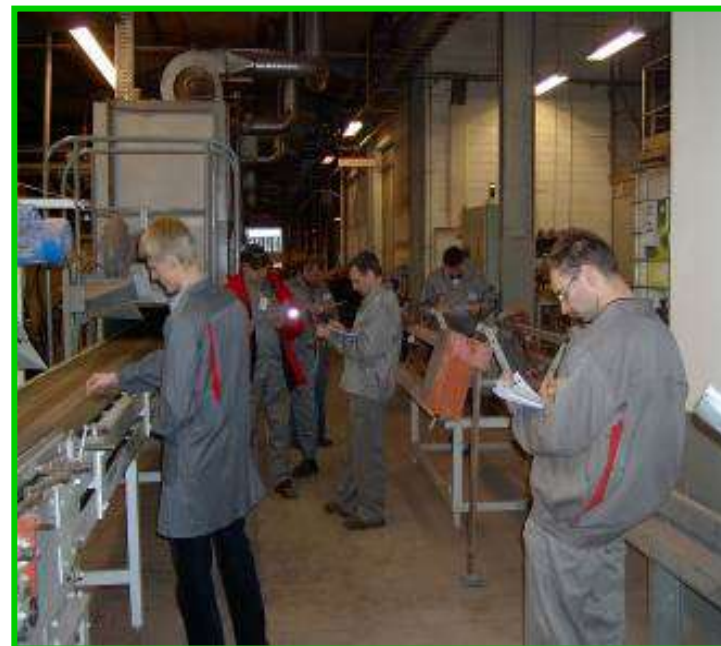
Zespół prowadzący auto-audit

Świętowanie osiągnięć w 5S w towarzystwie gości z „kwatery głównej”