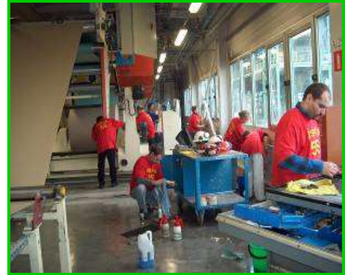
Akcja porządkowania podczas warsztatów 5S

Krok 5: Po zakończonym pilotażu, powtórzenie kroku 4 dla pozostałych obszarów. W zależności od wielkości fabryki i przeznaczonych zasobów, wdrożenie może zająć do 2 lat.